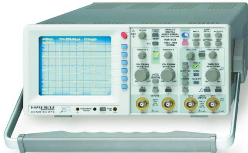
Bild 1: Ein Beispiel eines Analog-/Digital-Mixed-Signal-CombiScopes ist das 150-MHz-Oszilloskop HM1508 von Hameg.

Misst man ein Signal mit einem DSO, handelt es sich bei der Anzeige immer um eine mehr oder weniger gute, künstlich durch Interpolation nachbearbeitete Rekonstruktion (!) des Signals. Im Gegensatz dazu ist es bei Analoggeräten aus physikalischen Gründen ausgeschlossen, dass verzerrte, total verfälschte oder Phantomsignale angezeigt werden. Die Anzeige ist stets wahr und zuverlässig. Der Benutzer muss deshalb nicht wie bei DSOs das zu messende Signal bereits sehr gut kennen, um keinen Falschanzeigen zum Opfer zu fallen oder eine zwar im Prinzip richtige Anzeige im Geiste nachzukorrigieren. Bei einem Analoggerät muss man lediglich